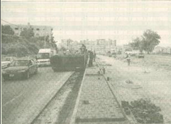
جانب من اعمال مشروع الباص السريع